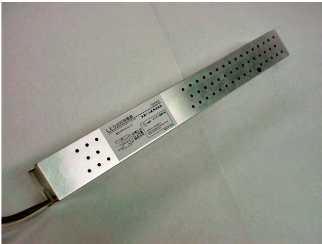
一般的な電源のサイズ比較 (断面)